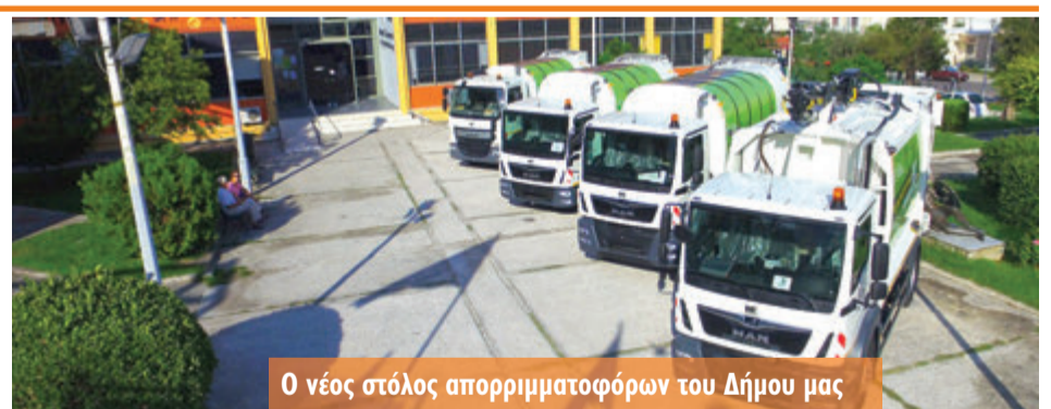
Ο νέος στόλος απορριματοφόρων του Δήμου μας