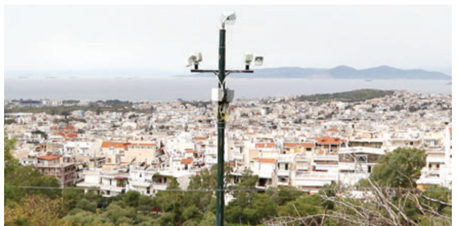
Οι υπερ-σύγχρονες κάμερες πυρανίχνευσης στο βουνό μας