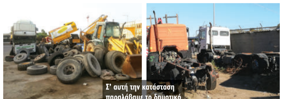
Σ' αυτή την κατάσταση παραλάβαμε το δημοτικό αμαξοστάσιο