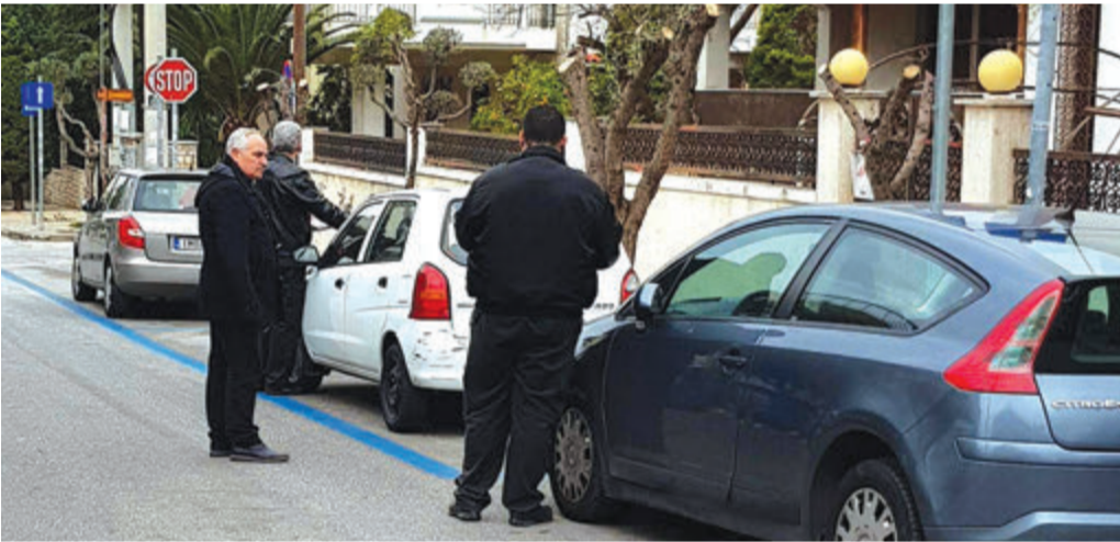
Η Δημοτική Αστυνομία επιβλέπει το μέτρο της Ελεγχόμενης Στάθμευσης

Στα άμεσα σχέδια της διοίκησης είναι η επέκταση του μέτρου της ελεγχόμενης στάθμευσης και σε άλλα σημεία του Δήμου, τόσο στο Ελληνικό, όσο και στην Αργυρούπολη που παρατηρούνται φαινόμενα κυκλοφοριακού φόρτου.