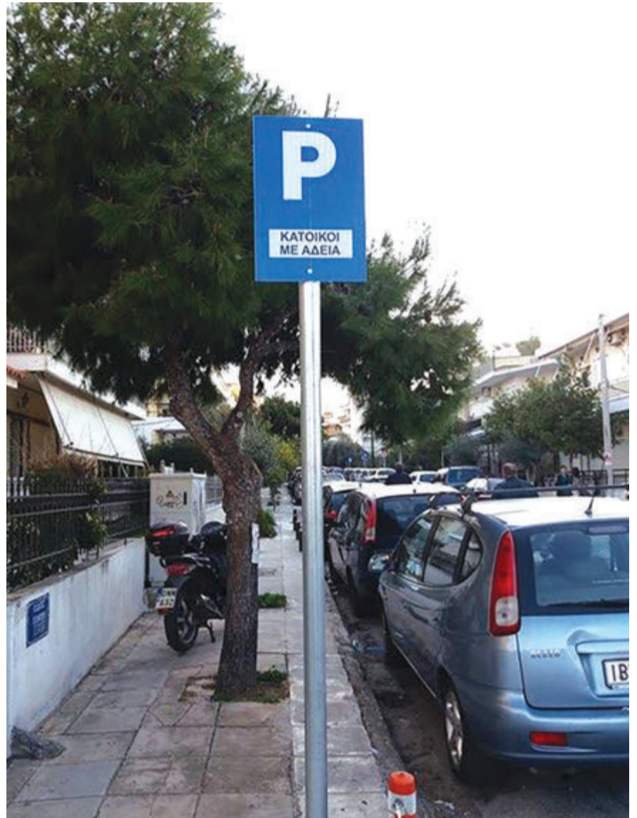
Οι κάτοικοι δηλώνουν ενθουσιασμένοι με το μέτρο το οποίο θα επεκταθεί τους επόμενους μήνες και σε άλλες γειτονίες της πόλης