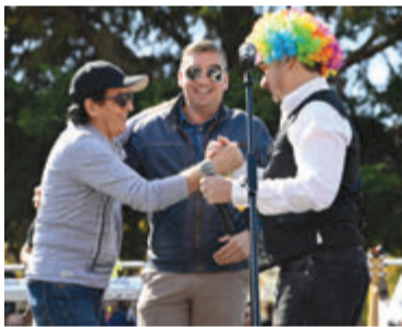
Την παρουσίαση έκανε με καυστικό και ιδιαίτερο χιούμορ ο ηθοποιός Σταύρος Νικολαΐδης.