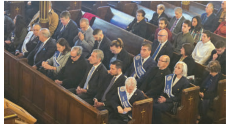
Στη δοξολογία που τελέστηκε στον ιστορικό Ελληνορθόδοξο Καθεδρικό Ναό του Αγίου Γεωργίου