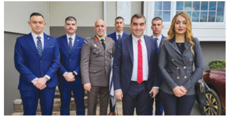
Με την αντιπροσωπεία των Ελλήνων Ευζώνων