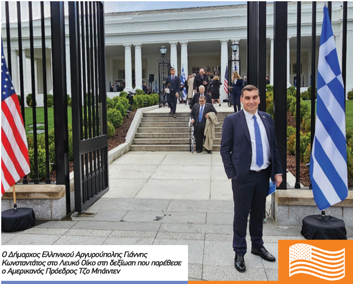
Ο Δήμαρχος Ελληνικού Αργυρούπολης Γιάννης Κωνσταντάτος στο Λευκό Οίκο στη δεξίωση που παρέθεσε ο Αμερικανός Πρόεδρος Τζο Μπάιντεν