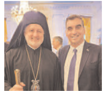
Με τον Αρχιεπίσκοπο Αμερικής Ελπιδοφόρο